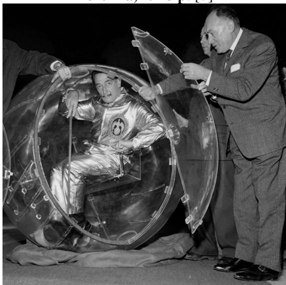
Рис. 3. С. Далі. Презентація «овосипеду», 1959 р. Париж, Франція [3]