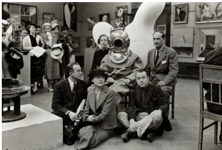
Рис. 6. С. Далі у скафандрі на Міжнародній виставці сюрреалізму, 1936 р., м. Лондон, Англія [6]