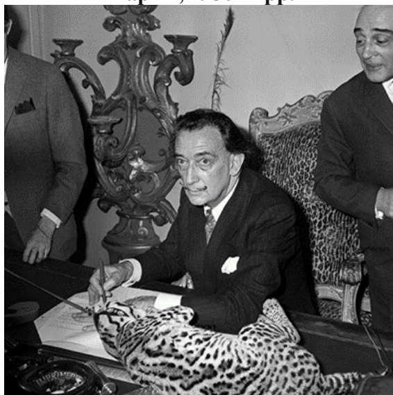
Рис. 4. С. Далі зі своїм вихованцем оцелотом Babou на презентації своєї книги «Lettre ouverte a Salvador Dali», 1965 р. [3]

Влаштуваючи виставку в Парижі в 1938 р. художник підготував, як завжди, нову несподіванку для зростання інтересу публіки. Незадовго до відкриття він заявив, що це