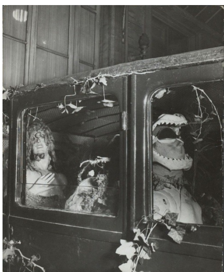
Рис. 7. С. Далі. «Дошове таксі», 1938 р., м. Париж, Франція