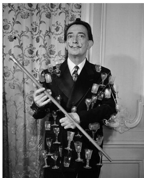
Рис. 2. С. Далі в піджаку «Афродизіак». Париж, 1950-ті рр.