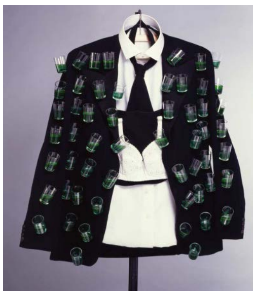
Рис. 1. С. Далі. «Піджак-афродизіак». Репліка, 1978 р. [7]

Експеримент мав неочікувані наслідки. Ніхто не міг почути його лекцію через герметичний костюм, який інструктор допоміг одіти йому перед виступом, і раптом через кілька хвилин він почав задихатися. С. Далі спробував показати, що йому потрібна допомога, аби зняти шолом, але публіка сприйняла це як частину його шоу та сміялася. Ось що розповідає біограф Меріл Секрест у своїй книзі «Сальвадор Далі: сюрреалістичний блазень»: «Чим більше він жестикулював, тим більше вони сміялися, і деякий час Далі думав, що знепритомніє, перш ніж йому вдалося пояснити все Девіду Гаскойну» [9]. Тим не менше, використаний гідрокостюм запам'ятовувався всім присутнім надовго, а разом з цим – винахідливий С. Далі.