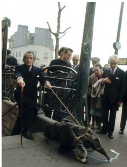
Рис. 5. С. Далі з домашнім мурахойдом виходить із метро, 1969 р., м. Париж, Франція [1]

буде однією із найдивовижніших подій першої половини ХХ століття. Так воно й сталося. Перед входом у будівлю на відвідувачів виставки чекав екстравагантний сюрприз – «Дошове таксі». Маєстро створив автомобіль, усередині якого йшов дощ, підлога була вистелена плюшем, а всередині на передньому і задньому сидіннях були розташовані два манекени – водій і пасажирка з розпатланим волоссям, по якому повзала сотня бургундських равликів (рис. 7) [5]. На сьогоднішній день своєрідне «таксі», доопрацьоване та доповнене пізніше художником, можуть побачити всі відвідувачі його театру-музею у м. Фігерасі, в Іспанії (рис. 8).