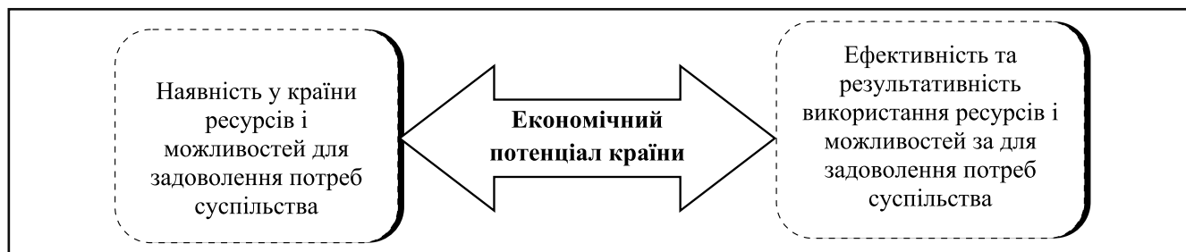
Рисунок 2. Векторальний розгляд терміну «економічний потенціал країни»