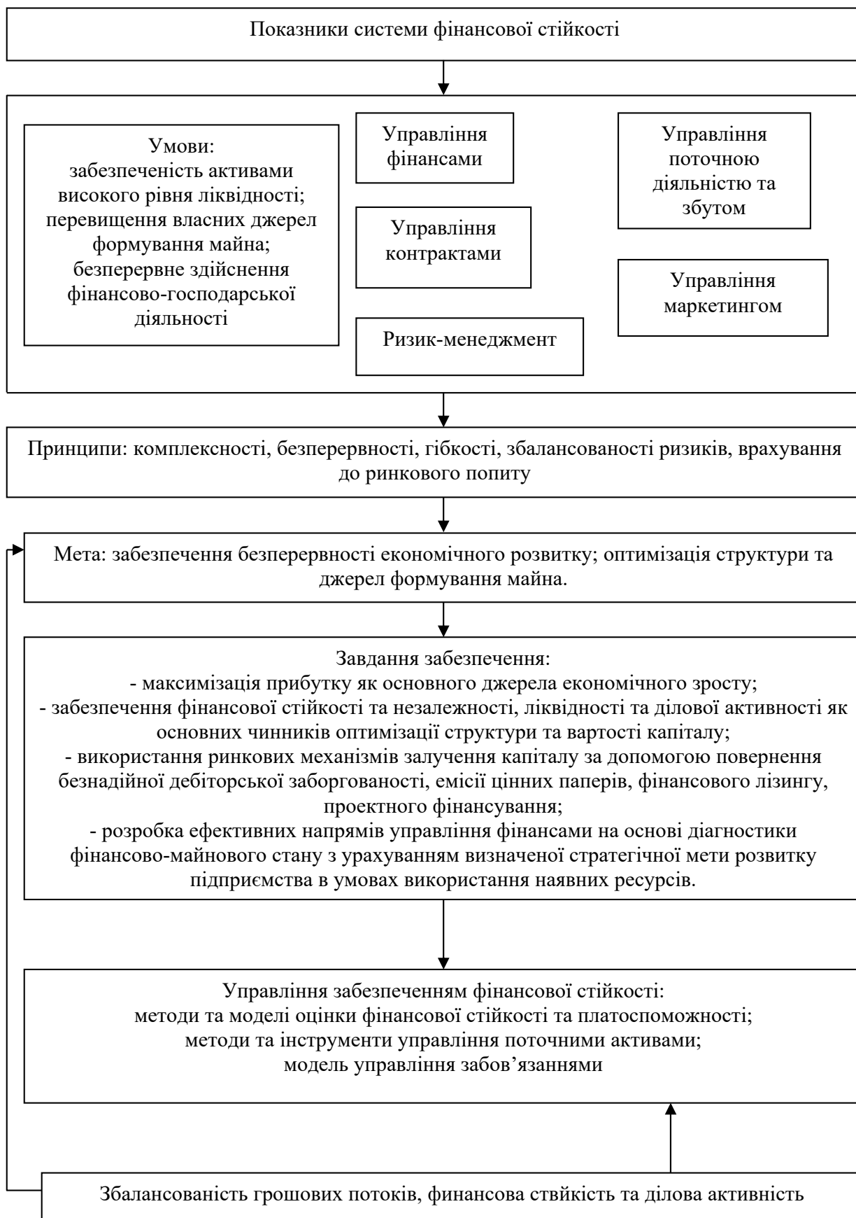
Рис. 3. Показники системи фінансової стійкості підприємств авіаційної промисловості