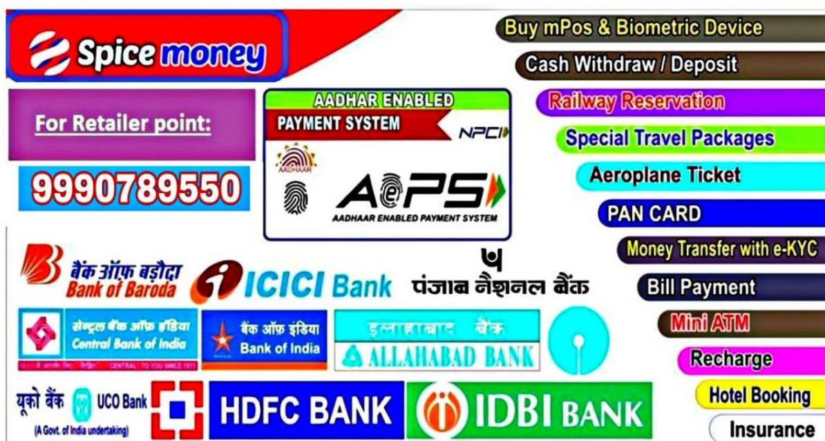
Рис. 1. Дизайн у стилі WEB.

На початку 2000-х у користувалися популярністю сайти оформлені у, так званому, стильовому напрямі WEB (рис.1). Згідно даних досліджень інтернет ресурсу Usabilitygeek [2], до 2010 року при створенні будь-яких сайтів обов'язковою вимогою при оформленні графічної оболонки була взаємодія з програвачем FLASH. Цей додаток давав змогу відтворювати он-лайн мультимедійні файли будь-якої складності. При цьому сайти виглядали занадто строкато, на них було багато композиційно не поєднаних між собою різних елементів, які гальмували роботу браузера і не давали можливості зрозуміти суть поданої на сайті інформації.