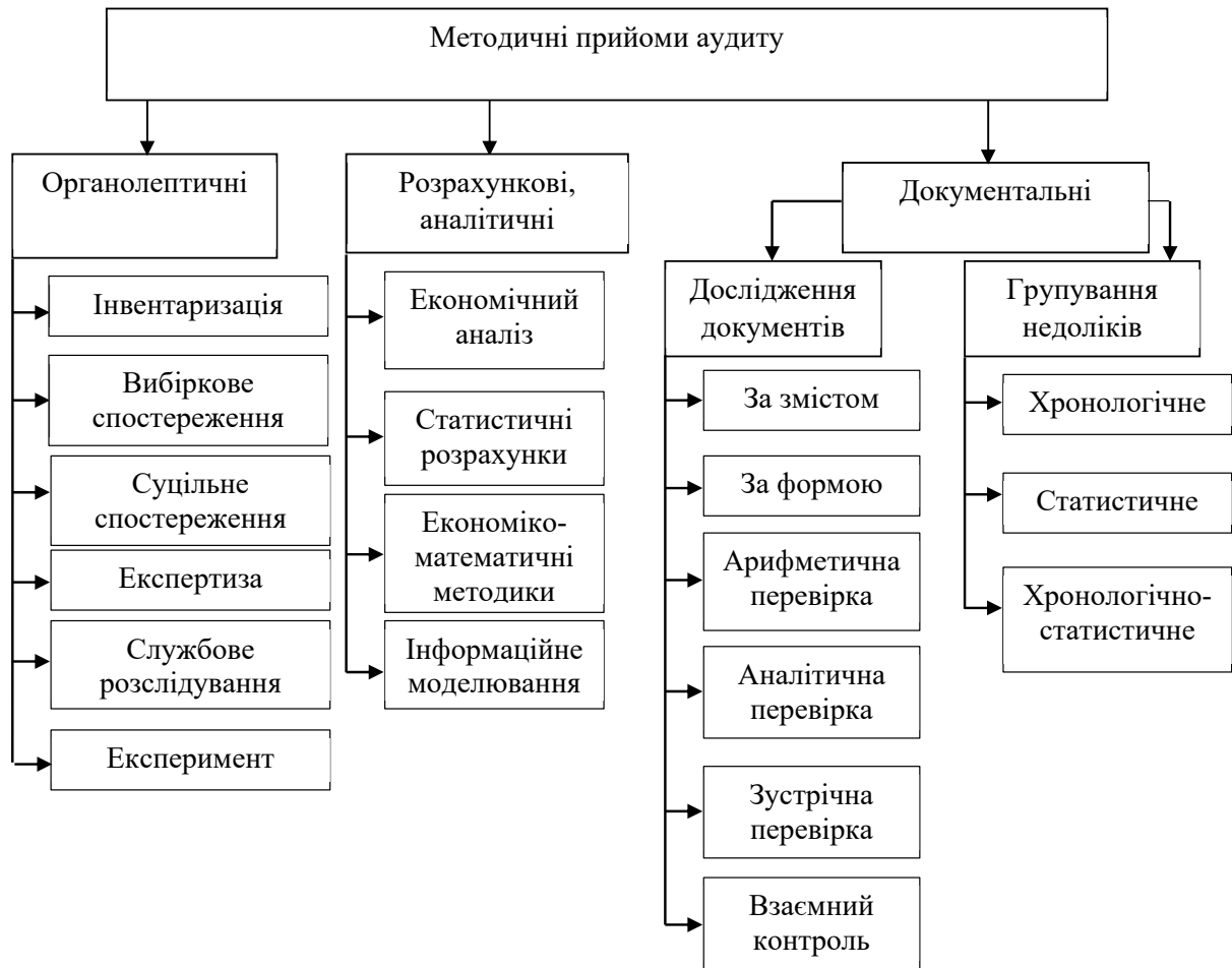
Рис. 2. Систематизація методичних прийомів аудиту основних засобів

необхідно оцінити систему внутрішнього контролю основних засобів, для чого застосовується тест внутрішнього контролю.