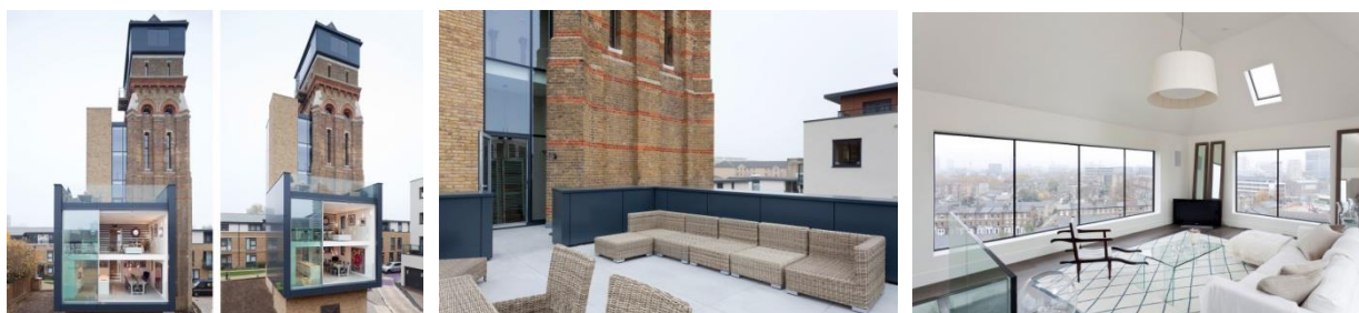
Рис. 4. Перебудова водонапірної вежі (Water Tower Conversion) в житловий будинок, Лондон, Великобританія; арх. «Agency 1st-Option» 2008 г.