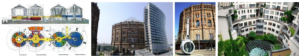
Рис. 1. Мультифункціональний комплекс в м. Відень, Австрія; арх. «Coop Himmelb (l) au», Ж. Нувель, В. Хольцбауер, М. Ведорн; 2001 р.

девелоперських підходів. Капітальні заводські цехи набувають нові функції – від музеїв до житлових і офісних будівель. Складніше розвивається ситуація з ревіталізацією інженерних споруд, в яких набагато менше вільного простору. Але кожен такий перетворений об'єкт унікальний в силу своєї композиційної структури, невластивої звичайним промисловим спорудам [1– 4]. Найчастіше яскраві приклади демонструють центричні споруди баштового типу – газгольдери, силоси з елеваторами, водонапірні вежі (найбільш показові об'єкти – багатофункціональний житловий комплекс на базі віденських газгольдерів (Рис. 1), цементна фабрика в Барселоні, елеватор в Кейптауні і ін.).