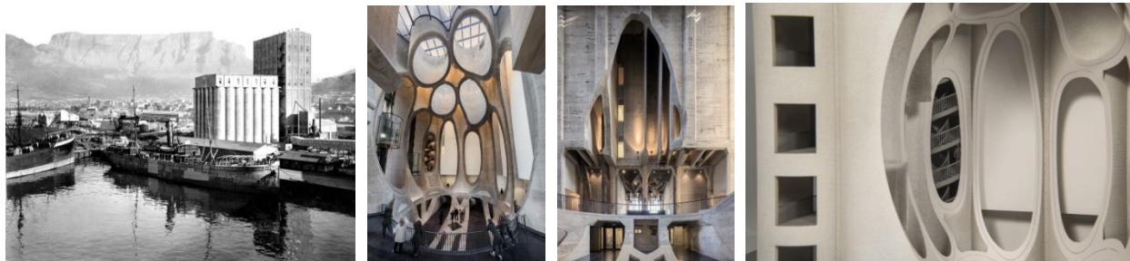
Рис. 2. Музей «Zeitzмосаа» в м Кейптауні, ПАР, арх. Thomas Heatherwick, «Heatherwick studio» 2017 р.

перетину, утворюючи атриум, освітлений через засклені перекриття (Рис 2). Зовні бетонні стіни елеватора очистили від штукатурки і фарби, а верхню частину прямокутного корпусу обернули скляною оболонкою з опуклими вікнами.