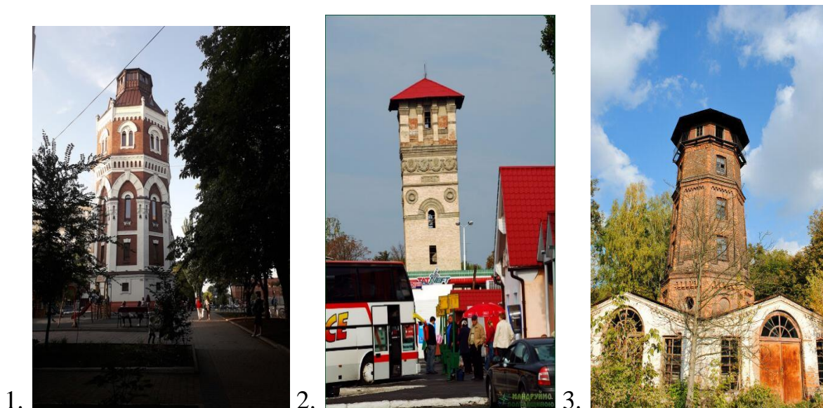
Рис. 5. Водонапірні вежі України: 1 – м. Маріуполь, 1910 р.; 2 – м. Пирятин, 1951 р.; 3 - с. Шпитьки, Київська обл., поч. ХХ ст.

У маленьких містечках і селищах по всьому світу збереглося досить веж простих конструкцій і оригінальних форм, що несуть зв'язок часів і здатних образно посилити місцеву ідентичність, навіть не будучи твором архітектури (Рис. 5). Типова і відносно проста об'ємна композиція таких споруд, як водонапірні вежі і цегляні труби, дозволяє дати універсальні конструктивні рішення для надбудованих та вбудованих елементів, тим самим вивільнивши творчу енергію для реалізації унікальних художніх рішень. Великий фактичний матеріал і необхідність роботи з вітчизняною промисловою спадщиною обумовлюють актуальність даного дослідження.