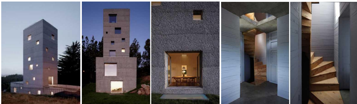
Рис. 4. Творча студія, місцевість Консерсьон (Чилі); арх. Mauricio Pezo і Sofia von Ellrichshausen

Культурно-дозвіллева функція передбачає організацію в об'єктах конверсії культурних центрів, бібліотек, творчих студій, клубів. Культурні центри часто діють як виставкові, концертні та театральні майданчики. Тут же можуть знаходитися репетиційна база і балетні класи, художні та музичні гуртки, лекторії, бібліотека. Залежно від наповнення, у них існує той чи інший профіль: культурно-розважальний або освітній. Така функція передбачає використання різних композиційних елементів. Якщо дозволяють простори, тут можуть розміщуватися репетиційні приміщення і естрадні майданчики. Можуть бути задіяні не тільки освітлені приміщення, але і темні відсіки інтер'єрів [6, с. 93].