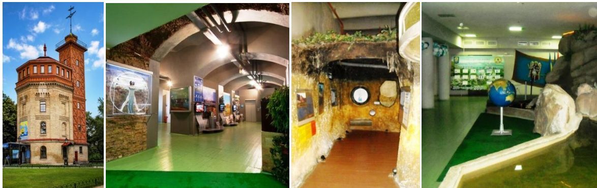
Рис. 5. Музей води в Києві (Водно-інформаційний центр)

створюючи суміш побутових приміщень і робочих студій, з'єднаних гвинтовими сходами. Проста прямолінійна сітка визначає розташування приміщень всередині будівлі. Конструкція є монолітним нашаруванням бетону. В інтер'єрі стіни оббиті панелями з пофарбованого дерева, в які вмонтовані оцинковані сталеві рами вікон [9].