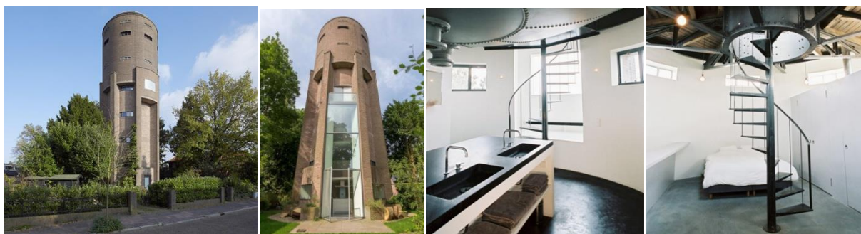
Рис. 2. Водонапірна вежа в Сусті, Нідерланди

Свого часу в кожному цивілізованому місті було по кілька водонапірних веж. А в посушливих країнах водонапірна вежа була епіцентром суспільного життя поселення, його віссю. У місті Афула (Ізраїль) стара водонапірна вежа і тепер сприймається, як домінанта міста. Хоча в наші дні такі об'єкти використовуються все рідше, старіють і руйнуються. Однак зі зростанням чисельності населення міст і попиту на житло, такі об'єкти все частіше пристосовують під приватні апартаменти. Співвідносячи функцію житла з композиційної типологією промислових споруд варто відзначити, що найбільш вдало і раціонально вона реалізується в адміністративних і виробничих приміщеннях міських мануфактур, старовинних портових складах. Але існують і більш рідкісні приклади – розміщення житла в циліндрах газосховищ і цукросховищ, а також перебудова водонапірної башти в готель, офіс, музей та ін. [6, с. 91].