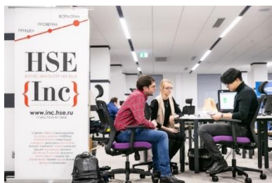
Рис. 1. Інтер'єр університетського бізнес-інкубатору HSE INC

До найбільш успішного бізнес-інкубатора країн пострадянського простору можна віднести Бізнес-інкубатор HSE INC (рис. 1, рис. 2), що втретє поспіль потрапляє у світовий рейтинг UBI Awards найкращих бізнес-інкубаторів. У перший раз бізнес-інкубатор HSE INC зайняв 14-е місце в категорії «кращий бізнес-інкубатор, керований університетом», в минулому році 7-е, а в цьому став кращим в категорії «університетський бізнес-акселератор».