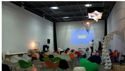
Рис. 3. Кластер «G13 project studio» у Києві на Балтійському провулку, 23