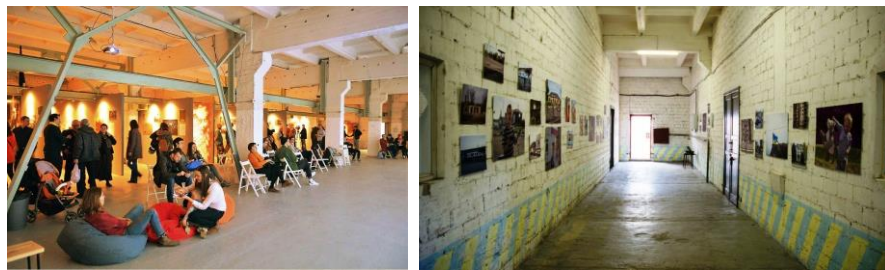
Рис. 2. Центр культурних ініціатив «Ізоляція», створений на території Київського судноремонтно-суднобудівного заводу на Подолі

Ще одним проектом з перетворення постіндустріальних руйн є центр культурних ініціатив «Ізоляція». Він з'явився в Донецьку в 2010 р. на території колишнього заводу з виробництва тепло- і звукоізоляційних матеріалів. Після відкриття центру у ньому відбулося кілька десятків художніх проектів з різних країн; тут почали влаштовувати кіноогляди і лекції. Проте у зв'язку з російською агресією центр «Ізоляція» довелося перемістити в Київ. Його розмістили на території судноремонтно-суднобудівного заводу на Подолі в одному з поверхів будівлі, який став виставковим простором і не лише ним. Тут є змога зануритися у захоплюючий квест. Адреса закладу – м. Київ, вул. Набережно-Лугова, 12. На арт-заводі у рамках проекту «Izone» функціонує органічне кафе і кілька майстерень, де бажаючі можуть скористатися устаткуванням фотолабораторії або створити унікальну друковану продукцію на літографських верстатах (рис. 2) [4].