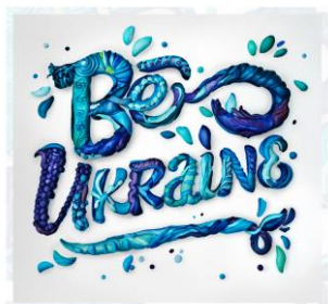
Рис. 4. Ольга Протасова