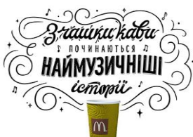
Рис. 1. Вікторія та Віталіна Лопухіни

Серед сучасних вітчизняних дизайнерів варто відмітити роботи наступних дизайнерів (рис. 1–9).