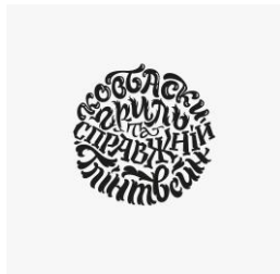
Рис. 7. Євген Спіжовий