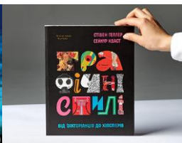
Рис. 3. Катерина Яцушек