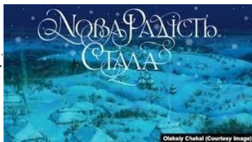
Рис. 2. Олексій Чекаль