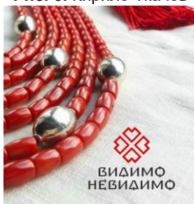
Рис. 9. Богдан Гдаль