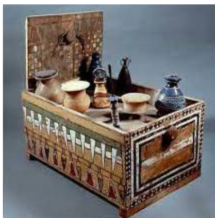
Рис. 3. Ларець з косметичними засобами знатної дами Мерит. XIV ст. до н.е. Єгипетський музей, м. Турин