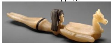
Рис. 5. Косметична ложка у формі жінки, що пливе і тримає блюдо. Бл. 1350 рр. до н.е. Музей Метрополітен, м. Нью-Йорк