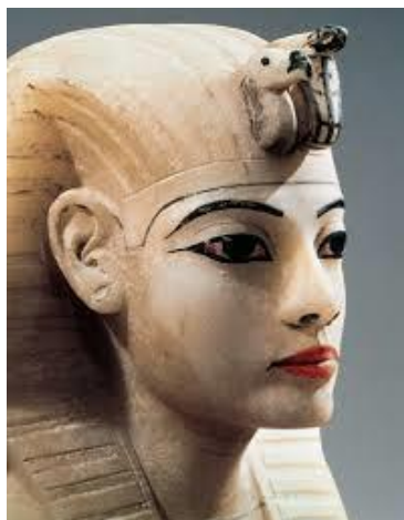
Рис.1. Голова Тутанхамона. Алебастр. Із гробниці Тутанхамона в Долині царів, Фіви. Середина XIV до н.е. Єгипетський музей, м. Каїр