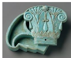
Рис. 4. Фаянсова шкатулка у вигляді капітелі колони для косметичних мазей. Бл. 660-300 рр. до н.е.