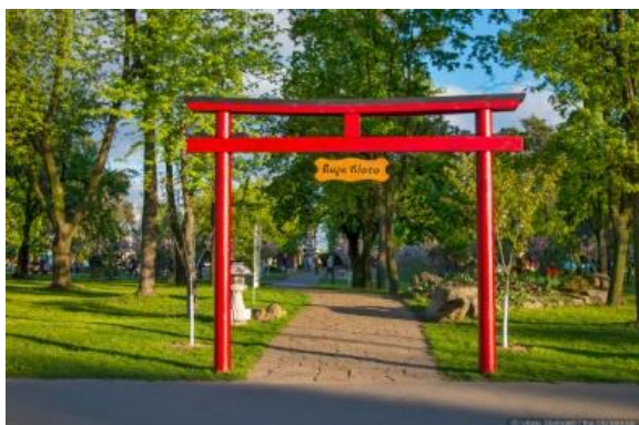
Рис. 8. Парк Кіото, Київ, засновано у 1972 р.