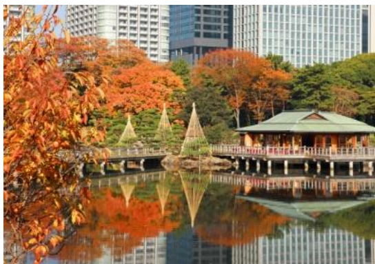
Рис. 6. Сади Хамарікю, м. Токіо Японія, заснований 1450 р.