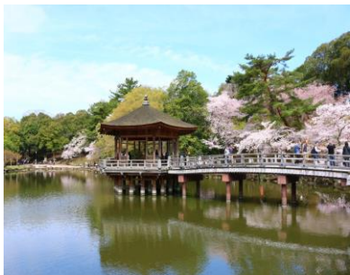
Рис. 1. Історичний парк в м. Нара. Японія