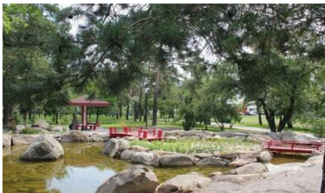
Рис. 7. Парк Кіото, Київ