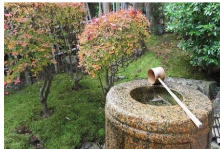
Рис. 3. Сад чайної церемонії. Японія, заснований 1880 р.