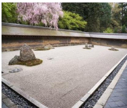
Рис. 4. Сад каміння рьоан-дзі м. Кіото, Японія, заснований у XVII ст.