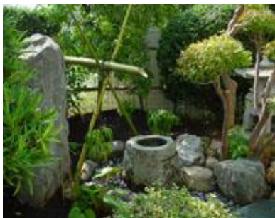
Рис. 2. Сад Цубо. Японія