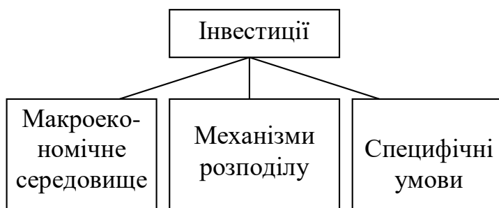
Рис. 2. Вплив регіональних умов на інвестиції

конкурентної позиції фірми, а також від місцевого середовища, в якій здійснюються ці інвестиції. Регіональна господарська середовище істотно впливає на характер протікання відтворювальних процесів, які, в свою чергу, залежать ще й від сформованої структури економіки.