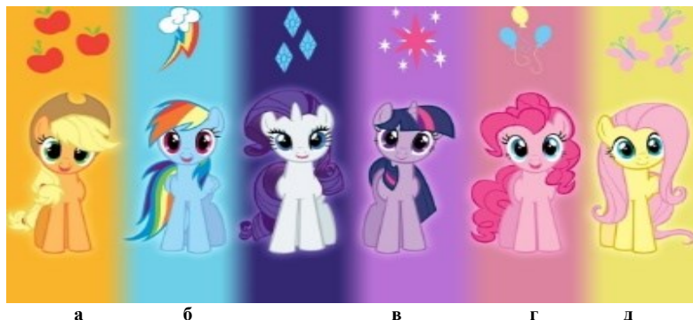
Рис. 1. Головні герої анімаційного серіалу «My Little Pony»: а – Епплджек, б – Рейнбоу Деш, в – Твайлайт Спаркл, г – Пінкі Пай, д – Флаттершай

Таким чином, усвідомлюючи величезну роль рольових ігор у розвитку дітей та бажання дітей одягатися в одяг костюмованого формату, розв'язувалась задача створити оригінальний, зручний у повсякденному використанні одяг, але в якому діти могли би перенестися у свій світ мрій. На основі дослідження казкової героїки анімаційного серіалу «My Little Pony» здійснено дизайн-проекування колекції одягу костюмованого формату [8]. Джерелом натхнення для створення моделей колекції стали головні герої з дитячого мультсеріалу (рис. 1).