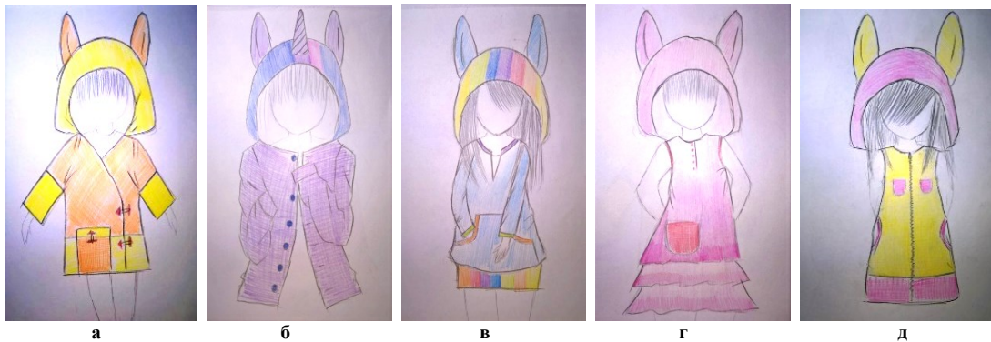
Рис. 2. Колекція трикотажних дитячих виробів за мотивами мультиплікаційного серіалу «My Little Pony»: а – кардиган «Епплджек», б – кардиган «Гвайлайт Спаркл», в – худі «Рейнбоу Деш», г – сарафан «Пінкі Пай», д – сарафан «Флаттершай»

В ході розробки моделей колекції проведено аналіз форм та колористичної гами образів головних героїв анімаційного серіалу. Розроблені моделі мають назву, що відповідають назвам головних казкових героїв (рис. 2).