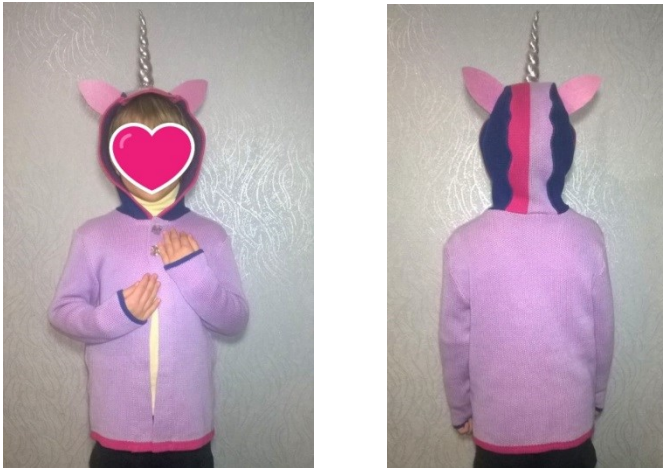
Рис. 3 Фото промислового зразка модель «Твайлайт Спаркл»

У якості промислового зразка розроблено та виготовлено модель дитячого кардигану «Твайлайт Спаркл» з покращеними споживними властивостями. Кардиган трикотажний дитячий, призначений для дітей ясельної та дошкільної вікових груп. Джемпер виконаний з пряжі бамбукової лінійної густини 29 \times 2 \times 2 текс та бавовняної 25 \times 2 \times 2 текс на плоскофанговій машині «Brother» 6 класу подвійним неповним жакардовим переплетенням. Зовнішній вигляд джемперу дитячого характеризується наступними суттєвими ознаками: