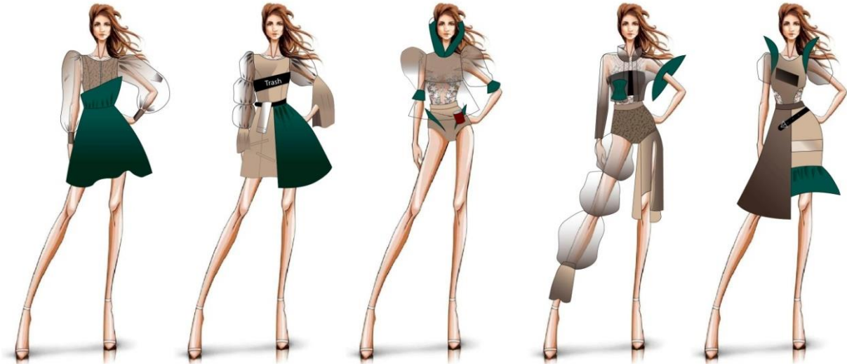
Рис. 3. Колекція моделей одягу в стилі Zero Waste

привертають увагу суспільства, намагаються не споживати товари з пластиковою чи іншою упаковкою, сортують сміття, дбайливо ставляться до речей, не використовують натуральні шкіру та хутро, що є шляхом в свідоме майбутнє. На основі колажу творчої ідеї була розроблена колекція моделей одягу (рис. 3).