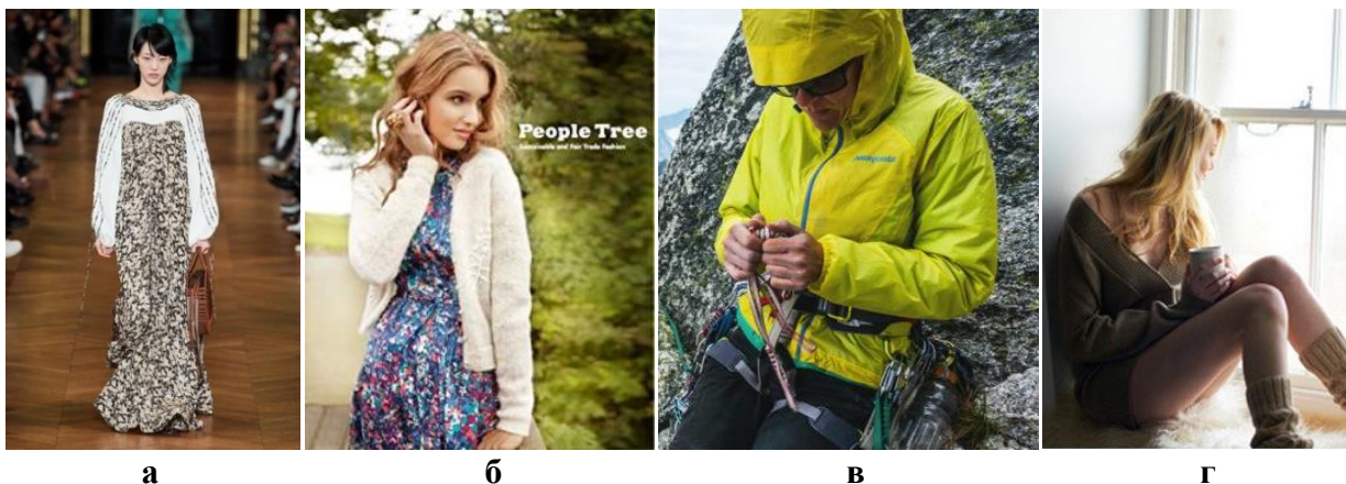
Рис. 1. Еко-мода на прикладі колекцій відомих дизайнерів: а – Стелла Маккартні, б – People Tree, в – Patagonia, г – Ciel

Екологічна ситуація, що загострюється, стала творчою концепцією для створення колекції одягу в напрямі свідомого споживання. Zero Waste – це спосіб життя, при якому люди намагаються максимально мінімізувати свій еко-слід і не викидати вживані речі. Колекція також має на меті привернути увагу до необхідності покращення екологічної ситуації в світі, проінформувати та підтримати їх зацікавленість.