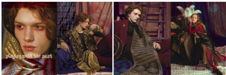
Рис. 3. Серия фотографий «Playing with the Past» с участием разработанных шелковых шарфов по мотивам слутских поясов

Нетривиальные декоративные решения нацелены разнообразить ассортимент сувенирных шейных аксессуаров с сохранением классической композиционной структуры исторического пояса. Ценовая категория такого сувенира может быть разной, это зависит от сырьевого состава нитей, используемых при ткачестве. Продукция обращает внимание жителей Беларуси и зарубежных потребителей на историю и культуру страны, благодаря наличию аутентичных изделий.