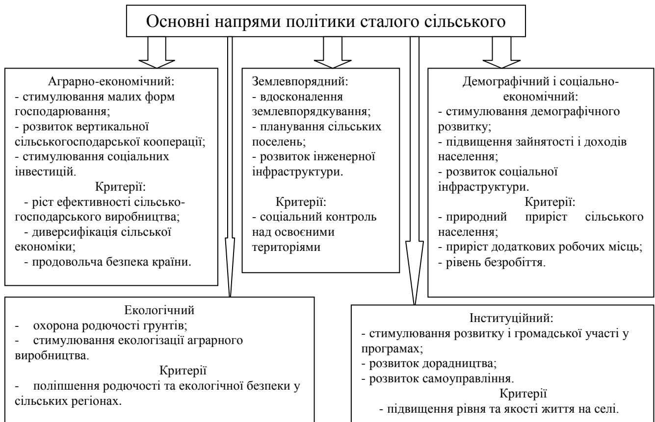
Рис. 3. Стратегічні напрями політики сталого сільського розвитку [2]

Отже, соціально-еколого-економічний розвиток аграрного сектору України має ґрунтуватися на принципах врахування можливостей природних комплексів і поступового зниження негативної дії антропогенного впливу на довкілля, а політика сталого сільського розвитку має перетинатися з аграрною, соціально-демографічною та екологічною.