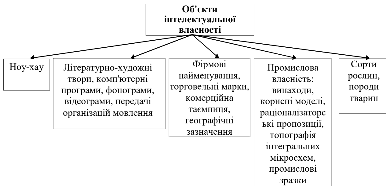
Рис. 2. Структура інтелектуальної власності

Виділимо основні завдання управління інтелектуальною власністю підприємства: