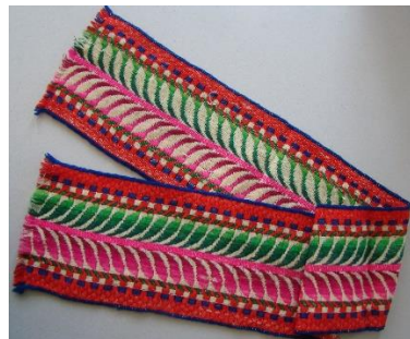
Іл. 2. Шалик, виготовлений на спеціалізованому обладнанні, Косів, 1920-1930-і рр. № 1098. Етнографічний музей у Кракові ім.. Северина Удзелі.