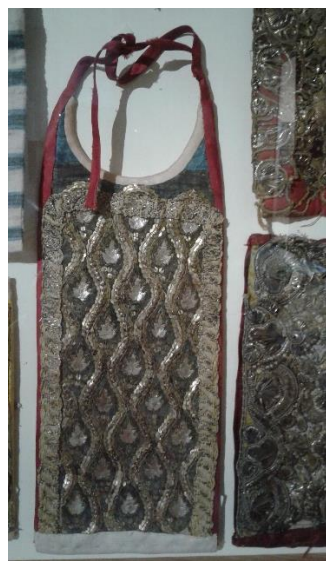
Іл. 4. Комір з мережива «іспанської роботи»: ритуальний компонент святкового чоловічого вбрання (кітелю), Східна Галичина, кінець XIX – перша третина XX ст. З експозиції виставки «Реліквії єврейського світу Галичини» з фондів Музею етнографії та художнього промислу, Львів, 2018.

Важливо зазначити, що для виробництва текстилю власники інколи спеціально будували або переобладнували приміщення, де було передбачено окремі цехи, склади, додаткові площі, що на той час вважалося доволі модерновим. Робочий час, оплата та умови праці регулювалися уставами та інспектувалися спеціальними представниками відповідних служб.