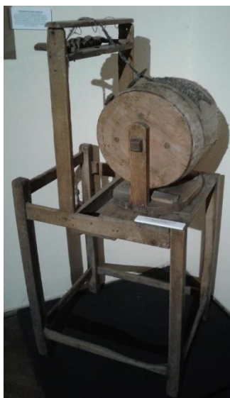
Іл. 3. Іл.3. Обладнання для виготовлення мережива «іспанської роботи», Сасів?, кінець XIX – початок XX ст. З експозиції виставки «Реліквії єврейського світу Галичини» з фондів Музею етнографії та художнього промислу, Львів, 2018.