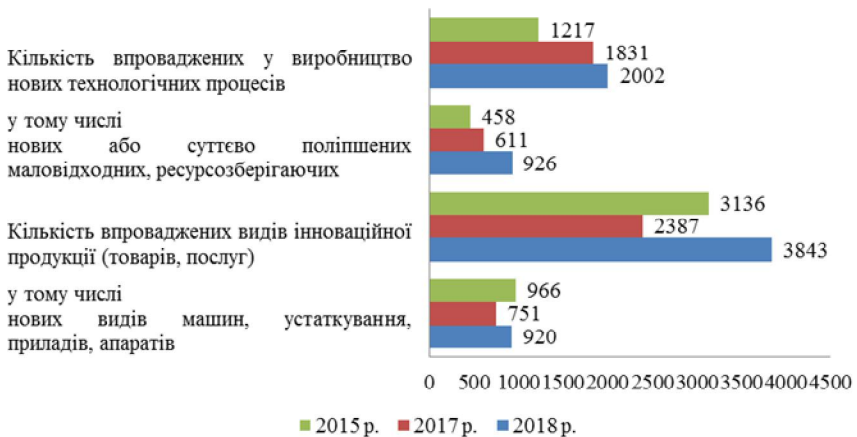
Рис. 1. Впровадження інновацій на промислових підприємствах України у 2015-2018 рр.

Джерело: розраховано авторами за даними [4].