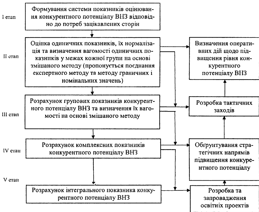
Рис. 2.19. Етапи оцінювання конкурентного потенціалу ВНЗ