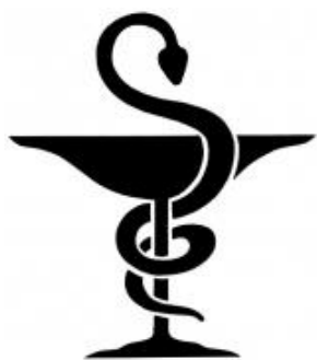
Рис. 1. Чаша зі змією