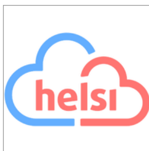
Рис. 7. HELSI