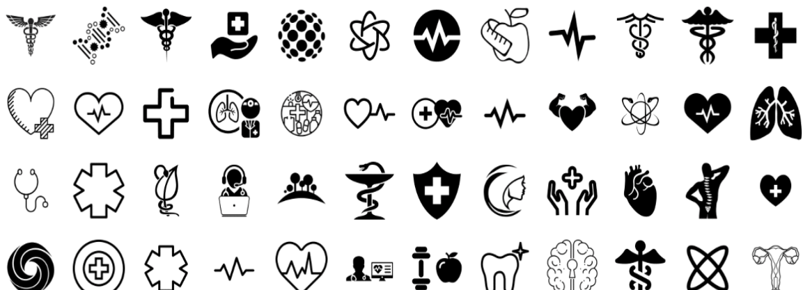
Рис. 6. Знак медичного закладу за напрямом діяльності

Вагомим прикладом для демонстрації нашої гіпотези є HELSI (рис. 7) – сучасна медична система, створена для пацієнтів, лікарів, державних медичних закладів України. У логотипі зазначеної віртуальної медичної системи зображено два серця, що символізують двоїстість символіки знакового змісту – елемент лікування і піклування про клієнта. Тому, на підсвідомому рівні, ця медична система візуально викликає довіру, й транслює сигнал спокою і надійності до своїх майбутніх пацієнтів. Графічна складова логотипу складається з ліній та літер однакових за розміром і товщиною ліній. Візуального дискомфорту завдає лише наявність великої кількості розриву ліній. Контур нагадує пунктир, що не дає змоги сконцентрувати увагу на логотипі в цілому. Загалом, знак надає доволі чітку та якісну візуальну інформацію, чим викликає довіру та попит на послуги.