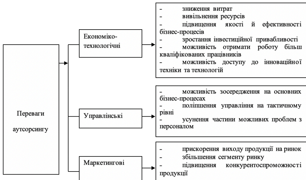
Рис. 2 Класифікація переваг аутсорсингу для швейних підприємств

Проведене дослідження дозволило систематизувати переваги та недоліки аутсорсингу для швейних підприємств (рис. 2).