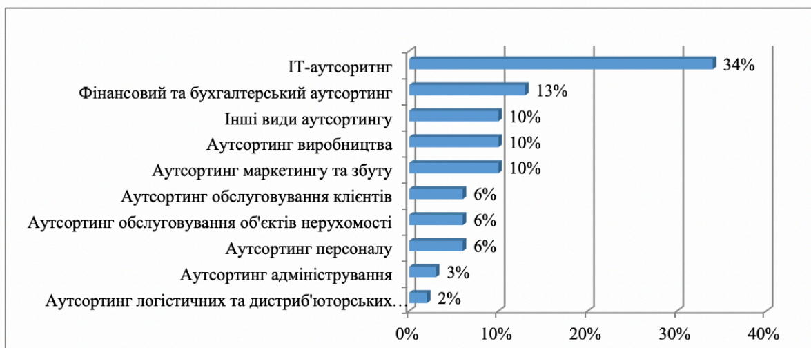
Рис. 1 Структура аутсорсингових послуг, що використовують зарубіжні підприємства

Структура видів аутсорсингових послуг, які є найпоширенішими для практики зарубіжних підприємств наведено на рис. 1.