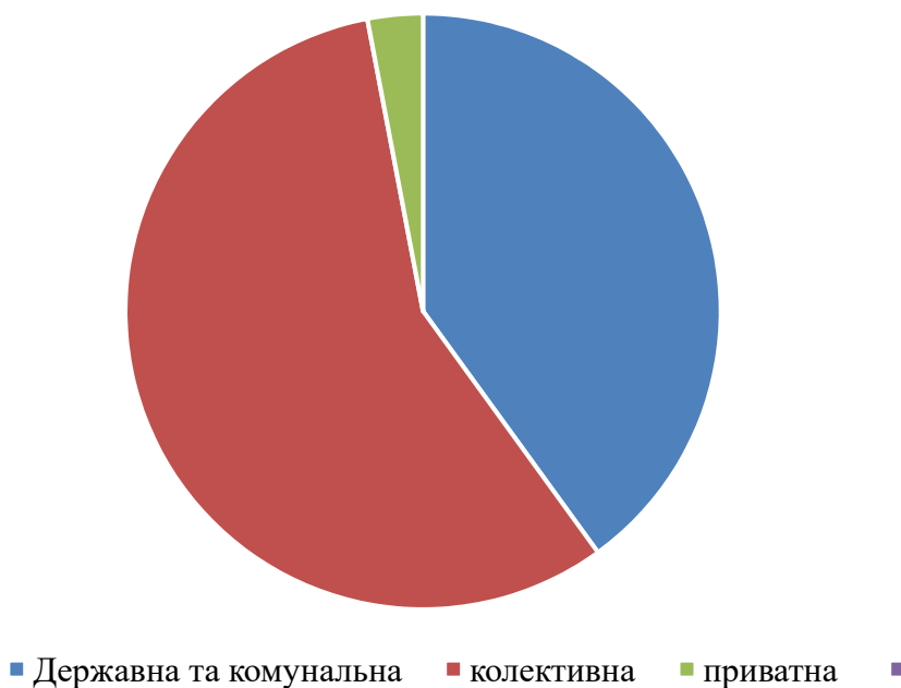
Рис. 1. Розподіл підприємств за формою власності

Це унікальні ресурси для перспективного розвитку туризму, зон рекреації і курортів та найбільш збережена частина природного довкілля. Площа освоєних та потенційних рекреацій територій в Україні (без радіаційно забруднених) становить 12,8% території країни і розподіляється відносно до природних особливостей саме рекреаційних регіонів: Карпатський, Придністровський, Дніпровський, Донецька-Приазовський, Поліський, Причорноморський. При визначенні цих регіонів враховувалися наступні фактори: геополітичне положення (розташування території, наявність трудових ресурсів, транспортних комунікацій, джерел сировини, енергії, історія розвитку території, традиції та ін.), наявністю рекреаційних ресурсів, стан туристичної інфраструктури, попит на рекреацію та туризм, туристично-рекреаційна політика регіону Найголовнішим у ефективному використанні рекреаційних ресурсів є наявність туристичної інфраструктури. Це готелі, мотелі, будинки відпочинку, пансіонати, санаторії, заклади харчування, транспортні засоби, заклади для розваг, атракціони та ін. Тут доцільно відзначити що на початок 2017 в Україні налічується 1258 підприємств готельного господарства загальною кількістю 100,67 тис. міс. За формою власності вони розподіляються таким чином 40% перебувають у державній та комунальній власності, 57% – у колективній та 3% – у приватній.