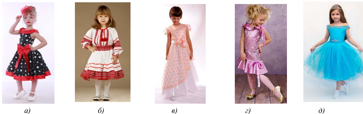
Рис. 1. Основні стилі дитячих суконь: а – ретро; б – етнічний; в – принцеса; г – русалка; д – фея

Для аналізу сучасних модних тенденцій було обрано провідні світові бренди як дорослого, так і дитячого одягу: David Charles, Dolce&Gabbana, Dorian HO, в яких були виявлені найтипівіші силуети для дитячих святкових суконь дошкільної групи (4–6 років) – це овал, прямокутник, трапеція, які використовують дизайнери у своїх колекціях та визначені типові силуети дитячих святкових суконь – це сонце, футляр, сарафан, балон [8–12]. Актуальними та найбільш поширеними є стилі дитячих святкових суконь – ретро, етнічний стиль, принцеса, русалка і фея, з характерними силуетами, конструктивними рішеннями, видами оздоблень (рис. 1) [4].