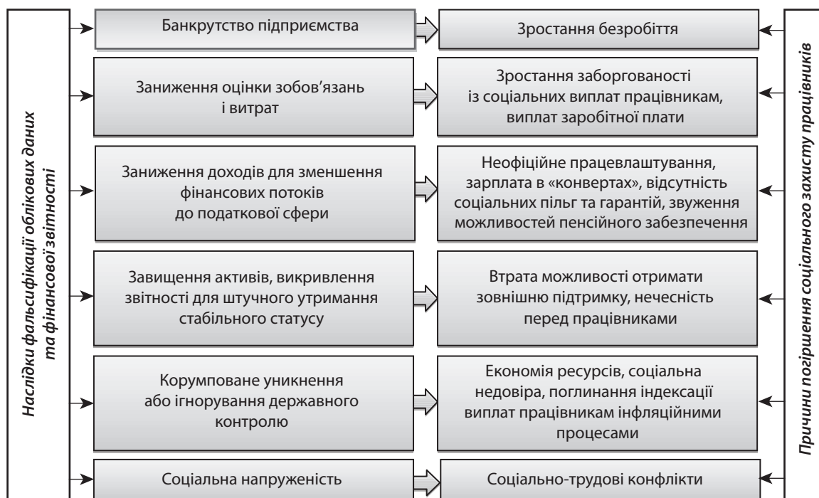
Рис. 1. Причинно-наслідковий зв'язок між обліковими фальсифікаціями та погіршенням соціального захисту працівників [2, с. 8]

Лідер Житомирської наукової бухгалтерської школи проф. Ф. Бутинець вказує на проблему відображення інформації про наявність дитячих садків, шкіл, лікарень, бібліотек, спортмайданчиків у складі річної звітності, яку раніше можна було побачити у звітах колгоспів і радгоспів України [3, с. 42]. На жаль, сьогодні таку інформацію майже не оприлюднюють. Наприклад, державне підприємство «Антонов», що працює в галузі вітчизняного авіабудування, розкриває інформацію стосовно наявної соціальної сфери в пояснювальній записці до звіту про виконання фінансового плану, а саме – ДП «Антонов» за рахунок власних коштів утримує та розвиває соціальну