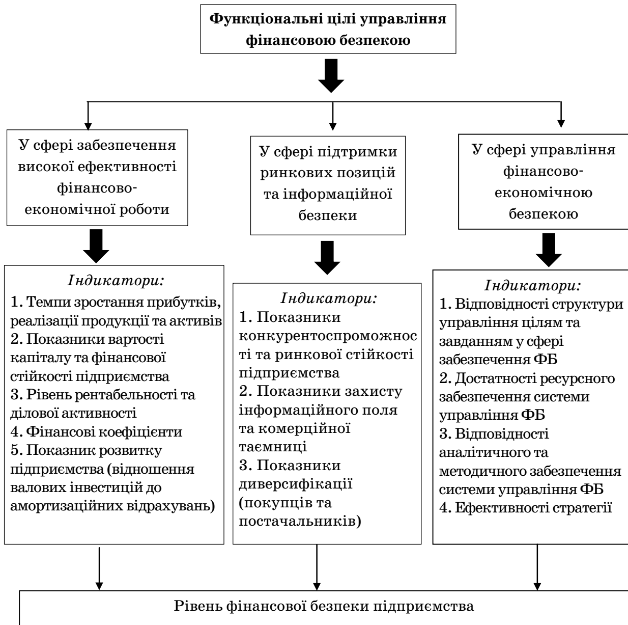
Рис. 1. Система функціональних цілей та індикаторів ефективності управління фінансовою безпекою підприємства

управління відповідно до факторів управління, на які здійснюється вплив. При неузгодженості інтересів неможливе здійснення ефективного впливу на реалізацію головного інтересу та досягнення системи пріоритетних фінансових цілей суб'єкта господарювання [7, с. 27–28].