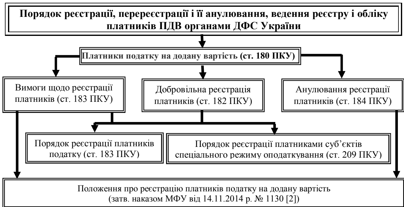
Рис. 1. Нормативне регулювання Порядку реєстрації, перереєстрації і її анулювання, ведення реєстру й обліку платників ПДВ органами ДФС України [4, с. 14]

Починаючи з 1 січня 2015 року, всі податкові накладні/ розрахунки коригування до них складаються платниками податку виключно в електронному вигляді [3].