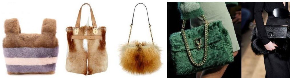
Рисунок – Сумки з хутра

Гармонійно виглядає в комбінації з високими чобітьми або ботильйони. Дутий пуховик не союзник хутряному аксесуару. Максимум це може бути тоненький неспортивний пуховичок, і нарешті для святкових і неформальних подій підійде клатч з елегантною хутряною обробкою.