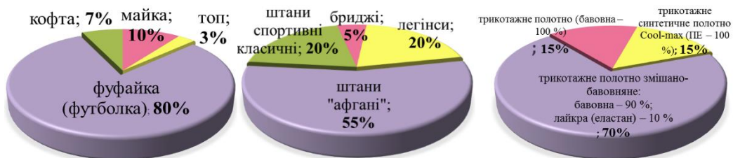
Рисунок 1 – Розподіл асортиментів виробів та видів матеріалів одягу для занять йогою за результатами анкетного опитування споживачів

З метою врахування думки споживачів при формуванні вимог до одягу складено анкету та проведено анкетне опитування двадцяти фахівців з йоги, а саме, жінок у віці від 26 до 35 років (тренерів з йоги та людей, що практикують йогу). За результатами анкети встановлено, що фахівці надають перевагу костюму, який складається з фуфайки та штанів «афгані». Популярними є також легінси. Серед матеріалів обирають трикотажне полотно змішано-бавовняне (рис. 1).