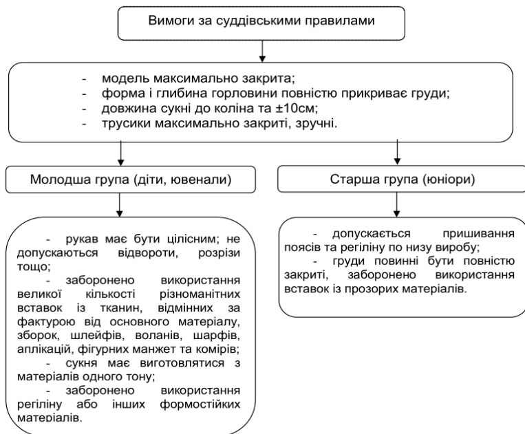
Рис. 1. Основні вимоги до дизайн-проекткування суконь для занять бально-спортивними танцями

Основні вимоги до суконь для занять бально-спортивними танцями наведено на рис. 1.